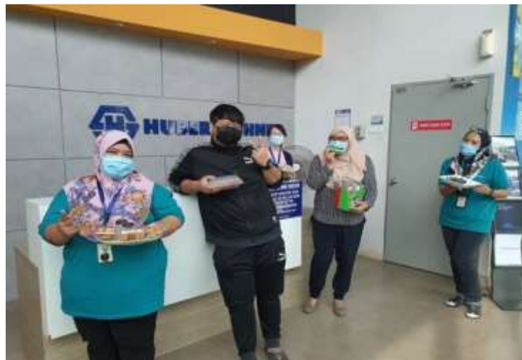
朝食ミーティング

- 評価、モチベーション、金銭面以外での利益を通じてチームワークを推奨、マネージャーとの朝食ミーティングや朝食配給などの物品支給、従業員の子供を対象とした絵画コンテスト