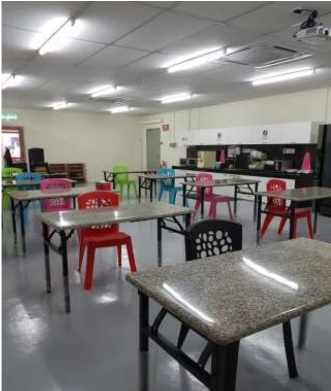
職場内のソーシャルディスタンス