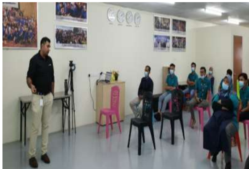
MD従業員エンゲージメント