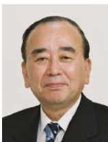
狩野 紀昭 博士 東京理科大学 名誉教授

TQM研究の分野における世界的権威。長年にわたりTQMの研究に携わり、“The house of TQM”, “Attractive Quality and Must-Be Quality” (魅力品質と当たり前品質、狩野モデル), “The Task Achieving QC Story” など品質管理分野において必須となった理論を含む300編を超える著書・論文があり、特にKano Modelの提唱者として世界的に知られている。1997年度デミング賞本賞、1997年American Statistical Association (ASA), Deming Lecturer, 2002年にはAmerican Society for Quality (ASQ), E. Jack Lancaster Medal, 2006年にはASQよりE. L. Gran Medalを受賞。そして2010年にはASQおよび品質運動に関する生涯にわたる貢献やサービスに対して授与される最高のメダルであるDistinguished Service Medalを受賞。2014年にはAsia Pacific Quality Organization (APQO)よりA. V. Feigenbaum Lifetime Achievement Medalが授与され、2016年には欧州で最も信頼の高いthe Georges Borel Award of European Organization for Quality (EOQ)を受賞、世界初のアジア(十日本)・米・欧での品質3冠を達成した。また、2010年にはアジア・クオリティ・ネットワーク(ANQ)に名前を冠したIshikawa-Kano Awardが創設されている。