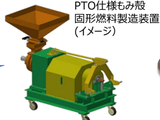
PTO仕様もみ殻 固形燃料製造装置 (イメージ)