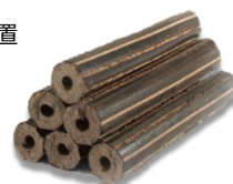
もみ殻固形燃料 「モミガライト」